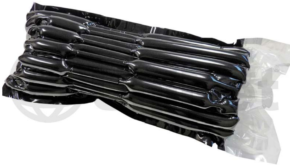
AIRBAG UNINET INFLÁVEL (COM SELAGEM)